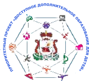
Муниципальный опорный центр дополнительного образования детей

27 центров во всех районах Смоленской области